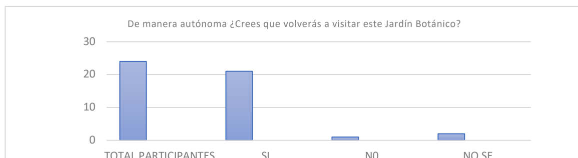
Tabla 2. Fuente: encuesta realizada por participantes en la salida de campo

Respecto a la tabla 2, los resultados indican que, de un total de 24 alumnos participantes que cursan la materia de Pintura de Paisaje, 21 de ellos dicen que les gustaría volver a visitar el Real Jardín Botánico, 1 que no le gustaría volver y dos que no saben. Respecto a los datos emanados de la tabla 3, se observa que, de los 24 participantes de esta actividad, 10 nunca había estado previamente en el Botánico.