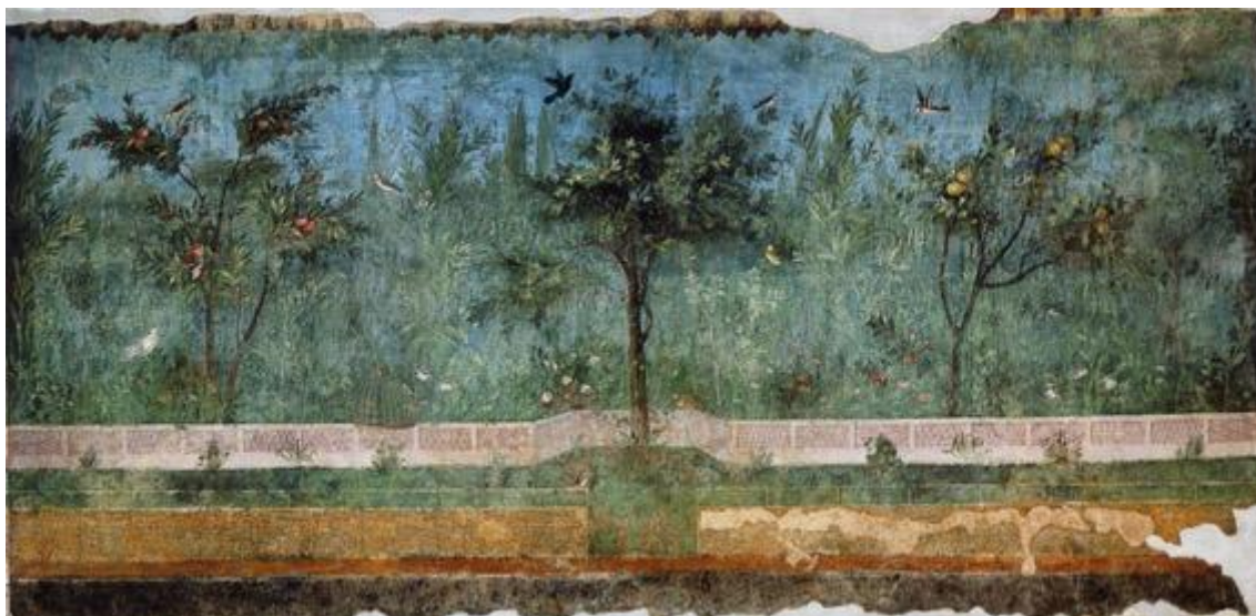
Figura 1. Jardín Villa Livia. Pintura mural. Principios s. I.

Europa, ya que los jardines tanto de Oriente como de Occidente han evolucionado a lo largo de los tiempos de diferente manera.