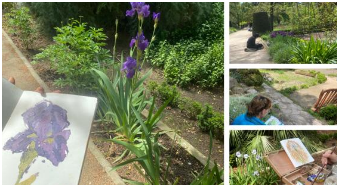
Figura 9. Ubicación 1. Sesión de Pintura de Paisaje realizada en el Real Jardín Botánico de Madrid.