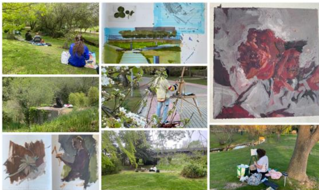
Figura 7. Ubicación 3. Sesiones de Pintura de Paisaje realizadas en el Real Jardín Botánico Alfonso XIII, UCM. Fuente: Original de la autora

Estas tres ubicaciones han sido utilizadas como talleres al aire libre, entendiendo la esencialidad de conocer, observar, analizar y disfrutar directamente de la Naturaleza tanto para la práctica de la pintura de paisaje como para la adquisición de conciencia y competencias ecológicas y medioambientales.