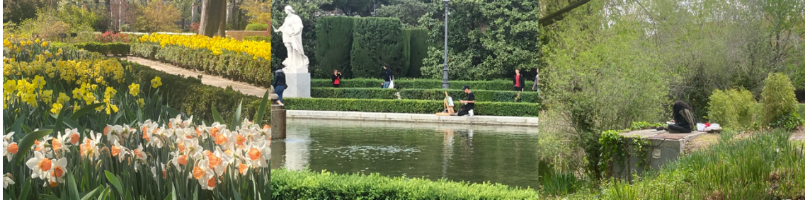
Figura 4. De izquierda a derecha: Real Jardín Botánico de Madrid, Jardines de Sabatini, Real Jardín Botánico Alfonso XIII (UCM), Madrid.