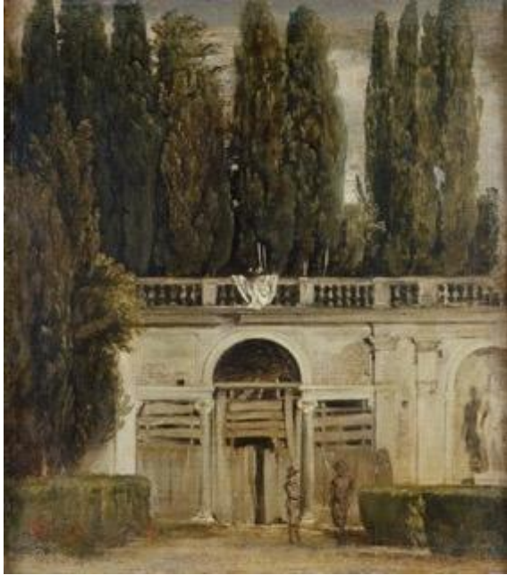
Figura 2. Villa Médici, c. 1630. Diego Velázquez, óleo sobre lienzo, 48,5x43 cm. Museo del Prado, Madrid