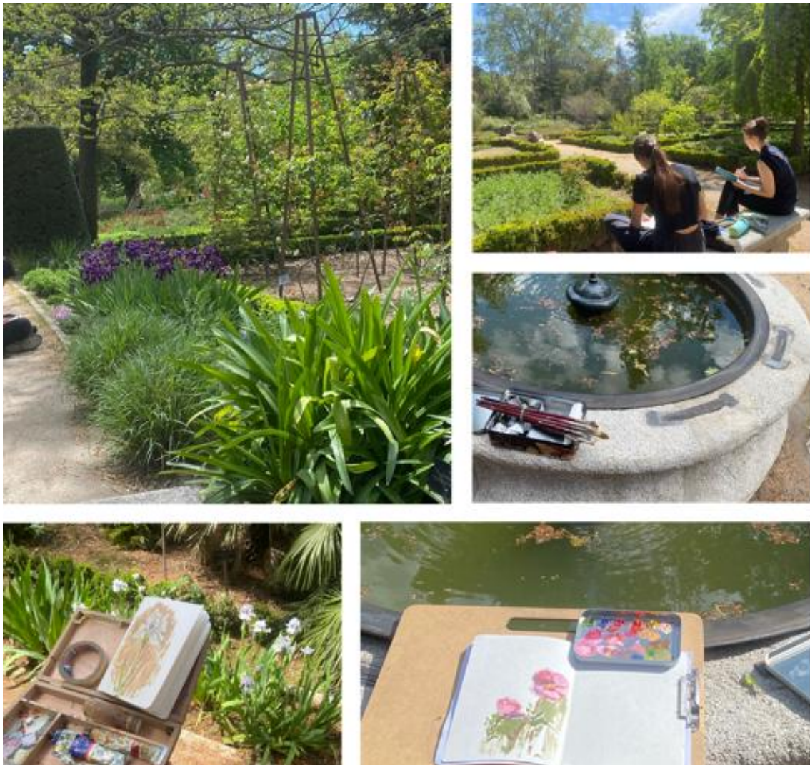
Figura 5. Ubicación 1. Sesión de Pintura de Paisaje realizada en el Real Jardín Botánico de Madrid.