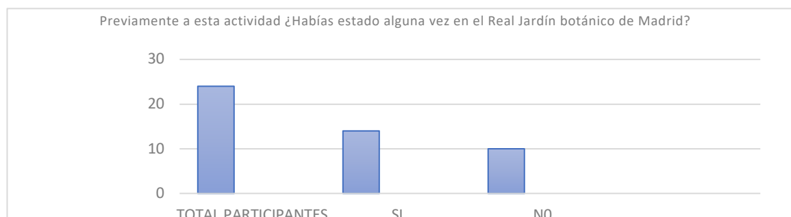
Tabla 3. Fuente: encuesta realizada por participantes en la salida de campo