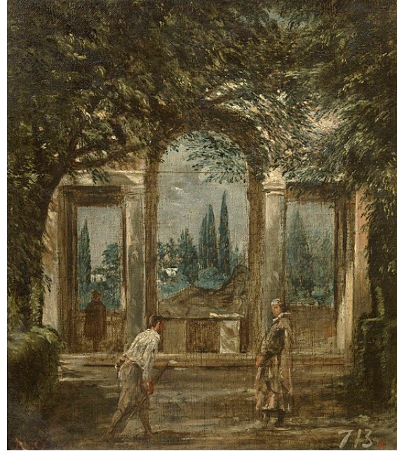
Figura 3. Jardín de la Villa Médici, c. 1630. Diego Velázquez, óleo sobre lienzo, 44,5x38 cm. Museo del Prado, Madrid

A lo largo de la historia, el jardín y sus diferentes variaciones han servido tanto a pintores, poetas y escritores como modelo de inspiración y tema principal para sus creaciones. Posiblemente, es en el siglo XIX cuando estos forman parte de una fuente interminable de posibilidades plásticas para los pintores, incorporando también a sus creaciones el concepto de parque público , cuyas características no son iguales que las de un jardín, ya que este primero es un espacio más de encuentro, diversión, lugar de hacer vida social. En Europa, a partir de la Revolución Industrial, surgió una época de urbanismo que originó la necesidad de poseer espacios abiertos, parques, y zonas verdes además de jardines para alejar a los ciudadanos del intenso ajetreo de la urbe, colaborando con ello a la mejora de su calidad de vida.