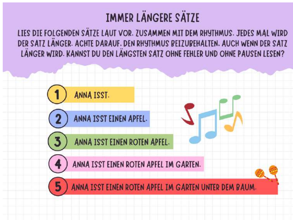
Imagen n°7: ejemplo de actividad para adición de complementos. Elaboración propia basada en el autor Ruttman, F. (2011).