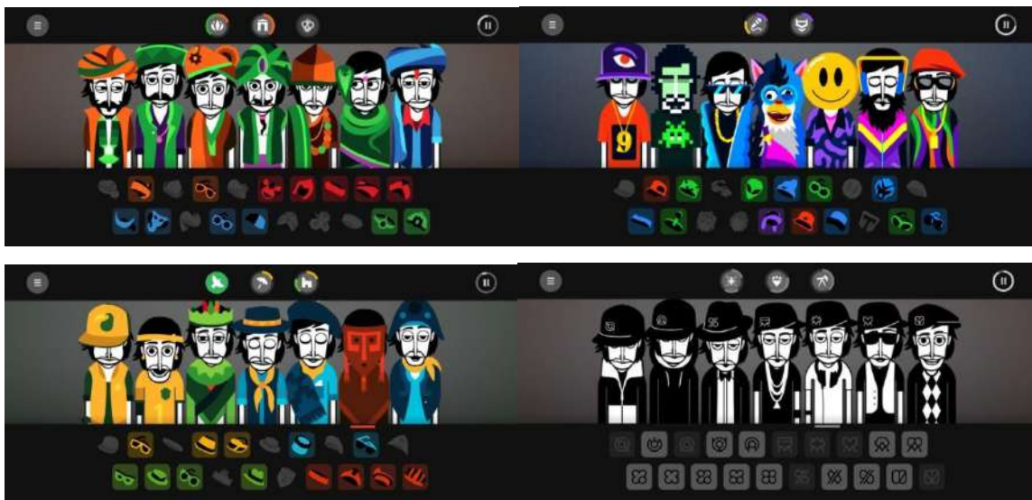
Imagen n°1: captura de pantalla realizada por la autora, Incredibox (So Far So Good, s.f.).

“Incredibox es una aplicación musical que te permite crear tu propia música con la ayuda de un alegre equipo de beatboxers” (So Far So Good, s.f.). No se necesita ser un experto en música o saber tocar un instrumento, ya que esta aplicación te permite crear y mezclar ritmos y melodías de manera intuitiva.