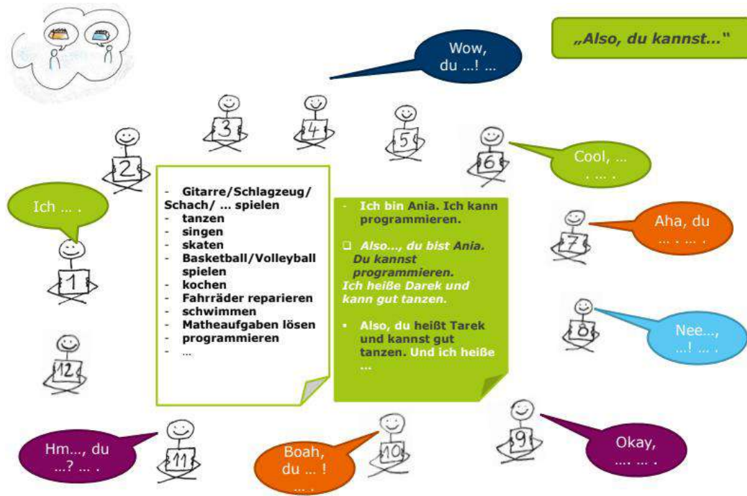
Imagen nº3: Kupis, M. (2023). Methodik und Didaktik: Deutsch für Erwachsene . Schwäbisch Hall: Präsentation im Rahmen des MDE 2.2 BL Methodik und Didaktik, 24. Juli - 5. August.