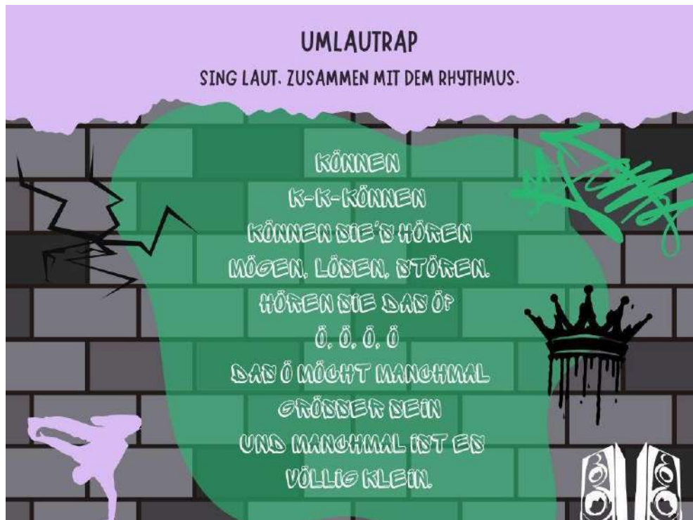
Imagen n°6: ejemplo de actividad basada en la pronunciación. Elaboración propia basada en el autor Eutopia. DE. (2020).

Paso 4: para finalizar, pide a los estudiantes que creen sus propios versos con las vocales Ä, Ö, Ü, manteniendo el ritmo musical.