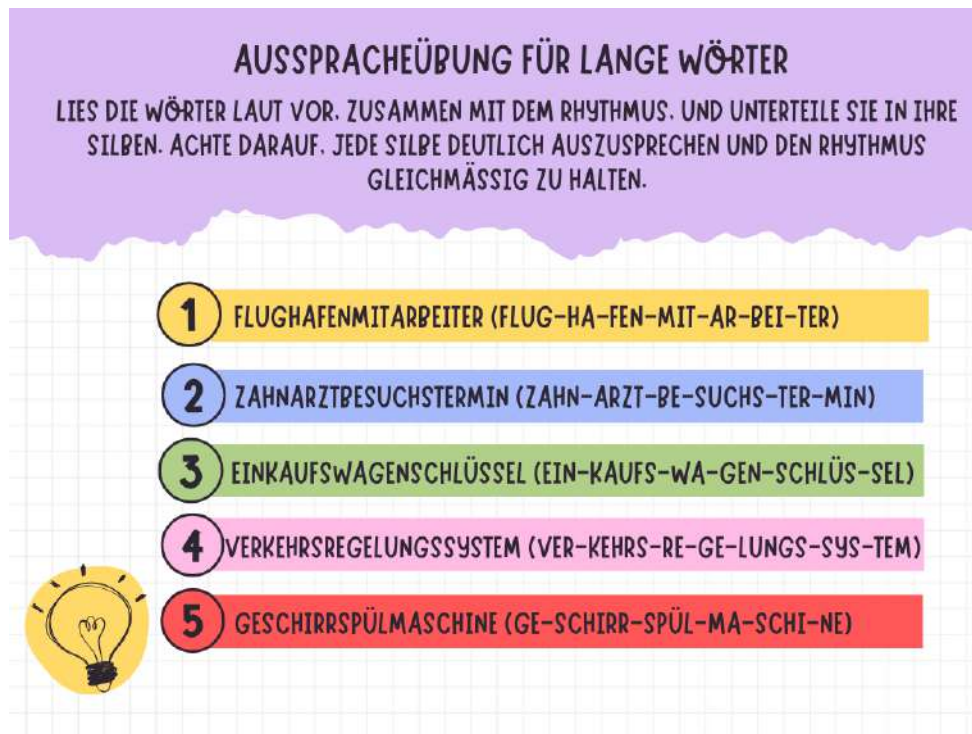
Imagen n°4: ejemplo de actividad en el ámbito de la pronunciación. Elaboración propia de la autora.