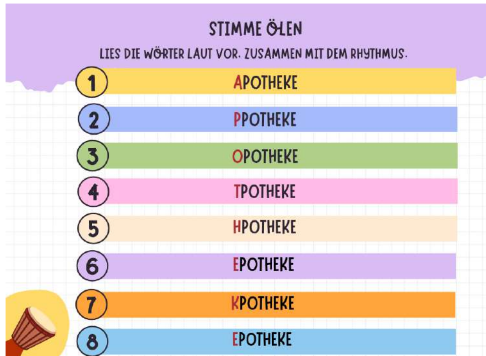
Imagen n°5: ejemplo de actividad en el ámbito de la fonética. Elaboración propia basada en el autor Saxinger, N. (2019).

Paso 4: introduce trabalenguas alemanes para aumentar la dificultad, pidiendo a los estudiantes que los repitan siguiendo el ritmo del instrumento, lo que les ayudará a mejorar tanto la fluidez como la precisión.