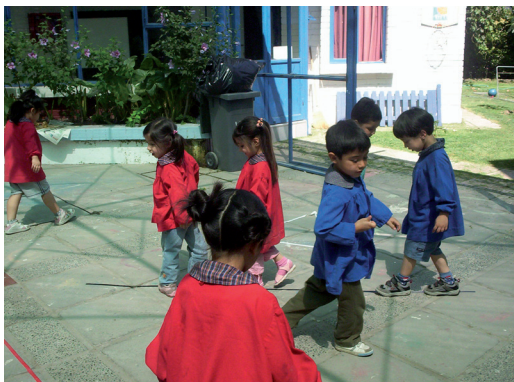
Jardín Infantil "Mis pequeños Angelitos". Maipú

Estas grandes áreas del desarrollo se refieren a lo cognitivo, lo valórico y lo afectivo, categorías que engloban las siguientes dimensiones: