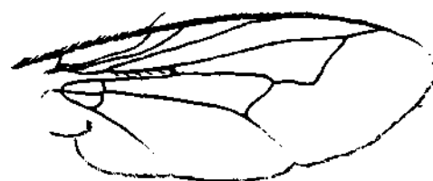
1) Ateloglutus blanchardi Cortés ♂ 2) Ateloglutus velardei Cortés & Valencia