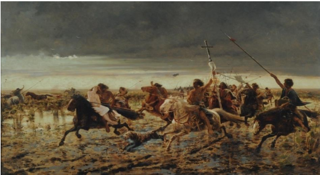
Figura 1. Della Valle, A (1892). La vuelta del malón .

En su libro De signatura rerum. Sobre el método (2010a), el filósofo italiano Giorgio Agamben decide aclarar el abordaje metodológico de sus investigaciones, desarrollando más profundamente el concepto de paradigma o figura paradigmática. Un concepto que, como dijimos, quisiéramos recuperar para analizar las derivas de una imagen fundante de la nación Argentina: La vuelta del malón , de Ángel Della Valle.