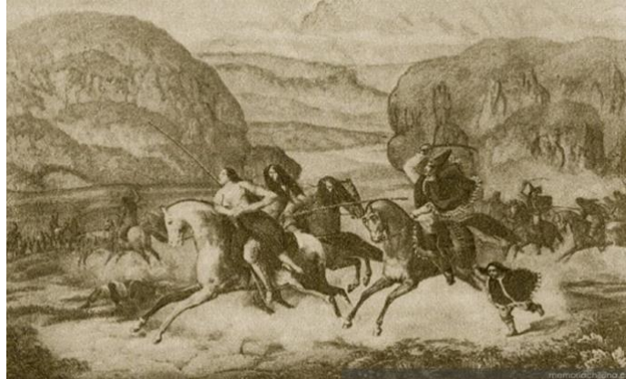
Figura 2. Poepping, E. F. (1840). Persecución de pehuenches por tropas chilenas .

diversas entidades histórico-culturales, con el objeto de iluminar cierta correspondencia entre ellas y de conformar, en consecuencia, una constelación o conjunto paradigmático (Agamben, 2010a)—.