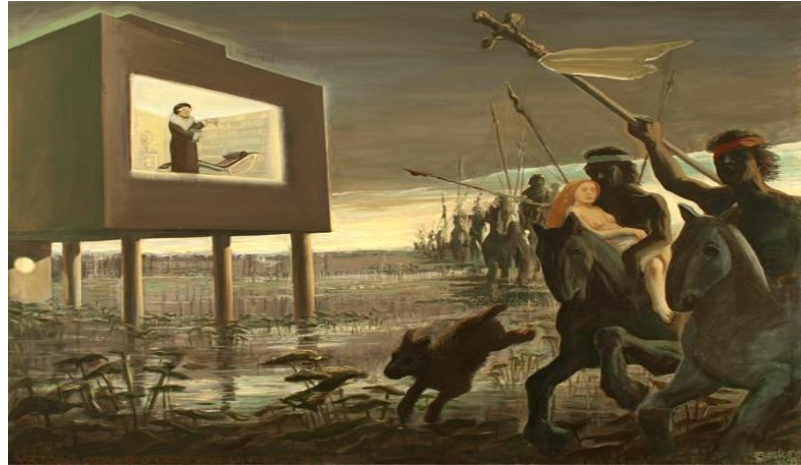
Figura 9. Santoro, D. (2011). Victoria Ocampo observa la vuelta del malón.