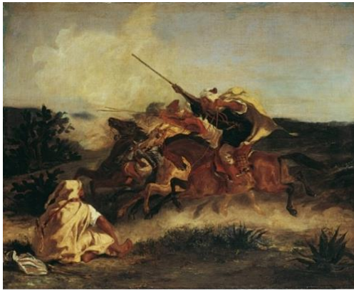
Figura 4. Delacroix, E. (1833). Fantasía árabe .

particular, permanece inmanente a las singularidades que se vinculan, siendo imposible separar con claridad “su condición paradigmática, su valer para todos, de su ser un caso singular entre los otros” (Agamben, 2010a, p. 26). Lo que significa que es un híbrido de multiplicidad y unicidad, ejemplaridad y singularidad, arquetipo y fenómeno, repetición y diferencia. 9