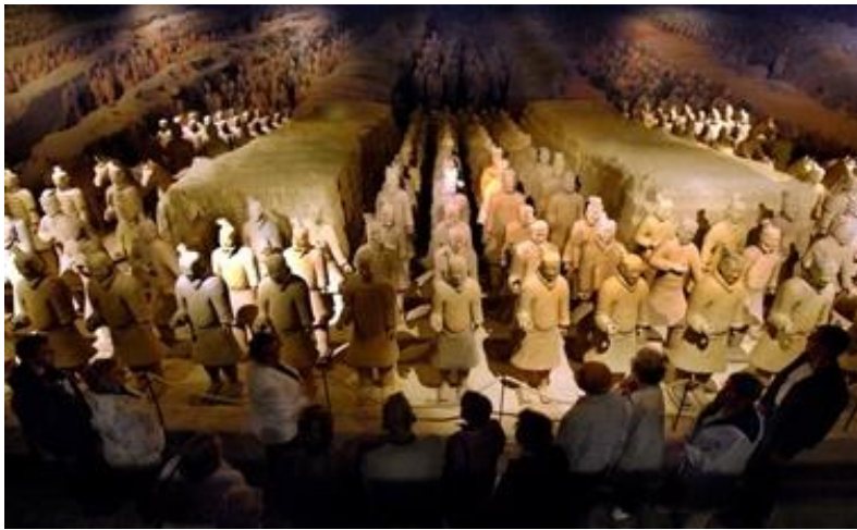
Figura 11. Guerreros de Terracota. Fueron encontrados bajo tierra en la ciudad de Xian, China, en 1974.

Y es esto lo que nos muestra, a nuestro entender, esta imagen (figura 10), en la que La vuelta del malón nuevamente se actualiza, aunque ahora como si estuviera saliendo del subsuelo de la ciudad de Buenos Aires (así lo revela el inconfundible obelisco que está detrás). Como si estuviera brotando de él, pero, sobre todo, como si siempre hubiese estado allí, aunque de forma latente, ubicada en el sitio sobre el cual se levanta, justamente, la ciudad civilizada . Algo que queda más claro si observamos que la imagen cita el famoso caso de los guerreros de terracota de la ciudad de Xian (China) —construidos hace más de 2000 años para custodiar el mausoleo del emperador Qin Shi Huang (figura 11)—, y que fueron descubiertos, bajo tierra, por el campesino Yang Zhifa en 1974 (Díaz Brochet, 2015). Guerreros que, por tanto, hacía mucho tiempo que estaban ahí, de manera latente, reprimida: