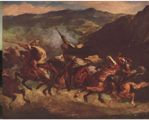
Figura 5. Delacroix, E. (1847). Fantasía marroquí .