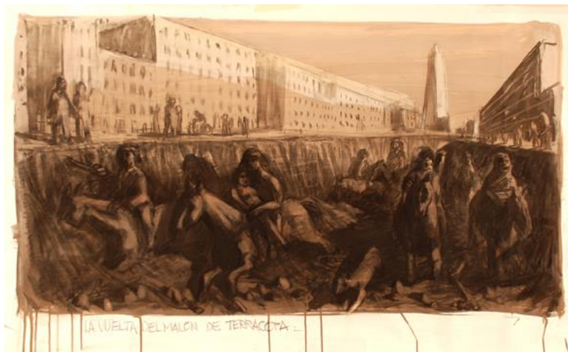
Figura 10. Santoro, D. (2011). La vuelta del malón de terracota . Fuente: Colección privada. http://www.danielsantoro.com.ar/obra.php?anio=20&obsel=2955

De esta forma, vemos que el malón , en tanto paradigma de la barbarie, vuelve de forma recurrente, aunque con otros rostros, con otras caras, en virtud de la mirada estereotipante y estigmatizadora de las elites blancas y los medios masivos. Ahora bien: ¿qué es lo que explica este retorno, esta constante producción de una barbarie por parte de unos sectores que la quisieran ver expulsada, marginada, eliminada? Principalmente, que la barbarie cumple un rol paradójico: así como es el producto de una mirada que desprecia y expulsa, es, a la vez, una condición de posibilidad para que esa mirada pueda existir. Es decir: es una “exterioridad constitutiva” (Mouffe, 2011, p. 22), necesaria para la conformación de la identidad civilizada. Para que esta pueda fijar sus límites y delimitar sus fronteras: