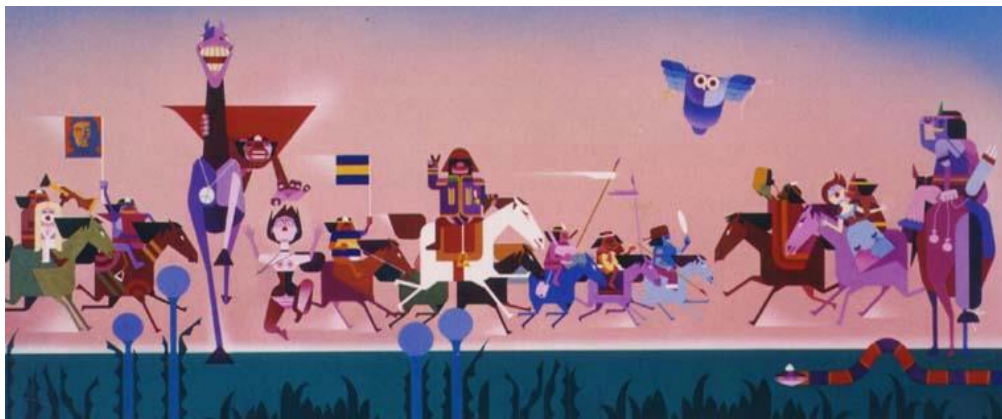
Figura 7. Revelli, F. (2003). La vuelta del Malón .

Varias son las imágenes contemporáneas que recuperan La vuelta del malón , que la retoman en tanto paradigma capaz de iluminar, de un nuevo modo, tanto el presente como el pasado del país. O en otros términos: que la actualizan en el marco de configuraciones que producen un dislocamiento en el reparto decimonónico argentino, un disenso con él, abriendo nuevos horizontes de sentido y, por tanto, generando nuevos repartos y distribuciones de lo sensible.