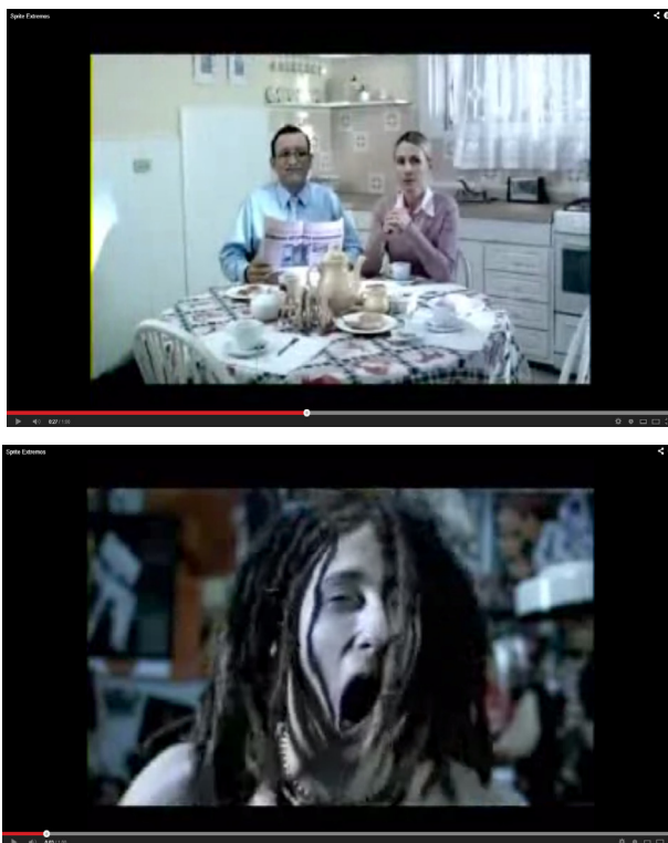
Imagén 1 2

Tipos de planos: Un plano general muestra la habitación del joven rasta y luego un plano detalle del cajón de la ropa del Rasta inicia el comercial. Este recurso sugiere las características del personaje. Luego aparece él, en un plano medio, olfateando su ropa. Un plano entero permite detallar las acciones del muchacho y describir su entorno, además de mostrar claramente su imagen al salir de su habitación. Con el joven organizado se utilizan similares recursos. Un primer plano describe su despertar, un plano medio muestra parte de su entorno y un plano general con ángulo natural exhibe el orden que reina en su habitación. La descripción del personaje continúa con un plano detalle de sus limpios zapatos y con un