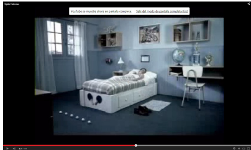
Imagen 2 3

plano entero que muestra lo pulcro que queda después de todas sus actividades. Los padres de ambos jóvenes se muestran en un plano medio con ángulo natural.