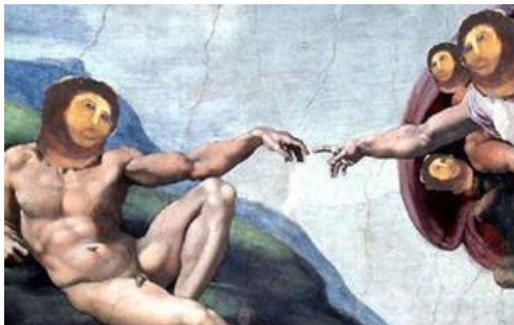
Mashup con detalle de la Capilla Sixtina de Miguel Ángel

contribuir a la reflexión respecto a la manera en que los profesores debemos enfrentar este ambiente que moldea a la sociedad de la información.