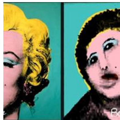
Mashup con obra Marilyn de Andy Warhol

en todos los ámbitos de la vida cotidiana y, evidentemente, en la educación, recordar las ideas del investigador canadiense puede