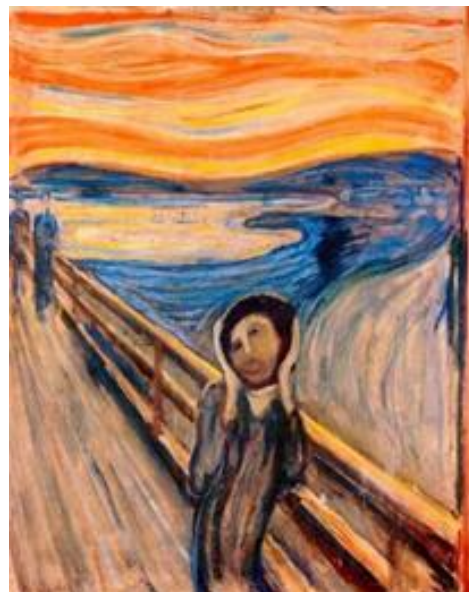
Mashup con El grito de Edward Much