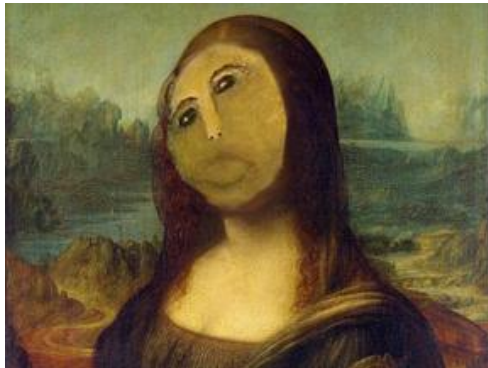
Mashup con La Gioconda de Leonardo da Vinci