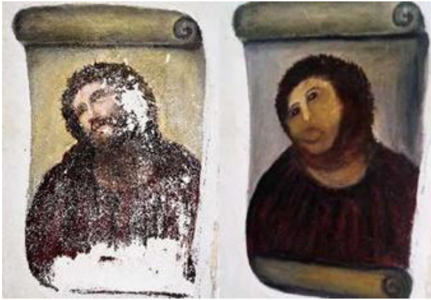
Versión original y versión “restaurada” de la obra Ecce Homo

perspectiva, en la aldea global se comparten los problemas, pero también las alegrías.