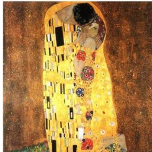
Mashup con El beso de Gustav Klimt

Con la extraordinaria aceptación que han tenido las redes sociales desde su aparición en la primera década del siglo XXI, es posible comprobar que los postulados de McLuhan tienen plena vigencia, razón por la cual cualquier estudio o análisis respecto de la tecnología en el ámbito de las comunicaciones necesariamente debe considerarlos. En el mundo globalizado, “hipercomunicado”, donde las tecnologías son parte fundamental